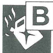
Flüssige oder flüssig werdende Stoffe