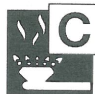
Gasförmige Stoffe, auch unter Druck