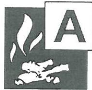
Feine glühende Stoffe